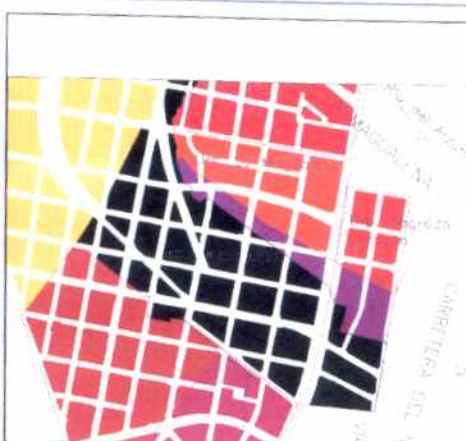
PLANO DE URBANIZACIONES

Las calles amplias y arborizadas, muestran una predialización definida pero flexible que abrió la posibilidad de construcciones con antejardines y aislamientos laterales. Esta posibilidad predial configuro una espacialidad urbana de características únicas dentro de Bogotá.