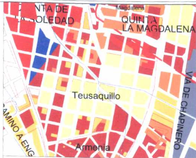
CRECIMIENTO HISTÓRICO - CRONOLOGÍA